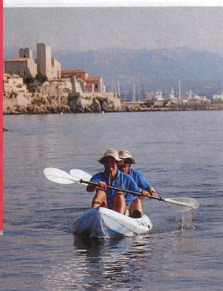
Vogue. Le kayak, simple, ludique et pratique pour se balader.

manipuler un kayak n'est pas la mer à boire. L'activité est accessible à tous, à condition de savoir nager. A Antibes, quelques structures organisent des sorties encadrées par des moniteurs, pour des balades allant de 1 heure à une journée. L'activité permet l'accès à de sympathiques criques, loin des foules. Le must: une excursion au coucher du soleil.