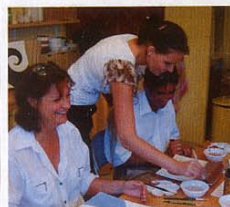
Création. Des ateliers pour composer son univers décoratif.

Tarif: 8 € les 2 heures plus le prix des pièces. 94, bd Beau-Rivage. 04.93.95.12.68. www.ceramic-crea.com .