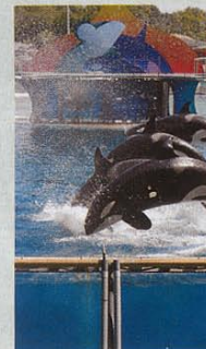
Contact. Au plus près des dauphins.

Approcher un dauphin, discuter avec des soigneurs... Le plus grand parc d'animaux marins en Europe propose de passer en coulisse, pour un contact direct avec le plus fascinant des mammifères marins. L'expérience dure une demi-heure