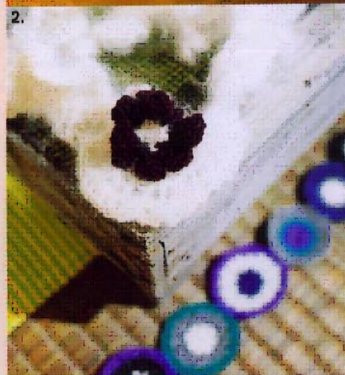
1. Les photophores joliment décorés des ateliers Marie Claire Idées... 2. Les bijoux au crochet de Facteur Céleste... 3. Et les gourmandises de Noël de À la Carte.